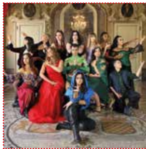
THEATER COMPANY DELLA LUNA