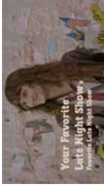
Your Favorite Late Night Show's Favorite Late Night Show